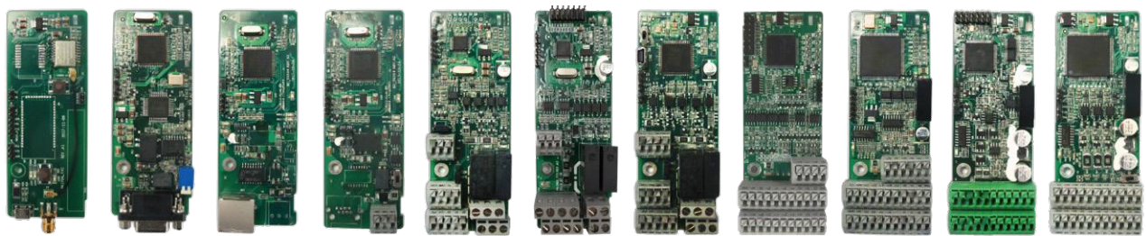
EC-TX501/502 EC-TX503 EC-TX504 EC-TX505/511 EC-TX501/502 EC-IO502 EC-PC501-00 EC-PG502 EC-TX503-05 EC-TX504-00 EC-PG505-12

این دستگاه مجهز به تکنولوژی‌های کنترلی پیشرفته و پردازنده‌های قدرتمند مخصوص درایو می‌باشد. در کنار همه اینها، با قابلیت تجهیز دستگاه به انواع کارت‌های جانبی، امکان برآوردن نیازهای مختلف مشتریان فراهم است.